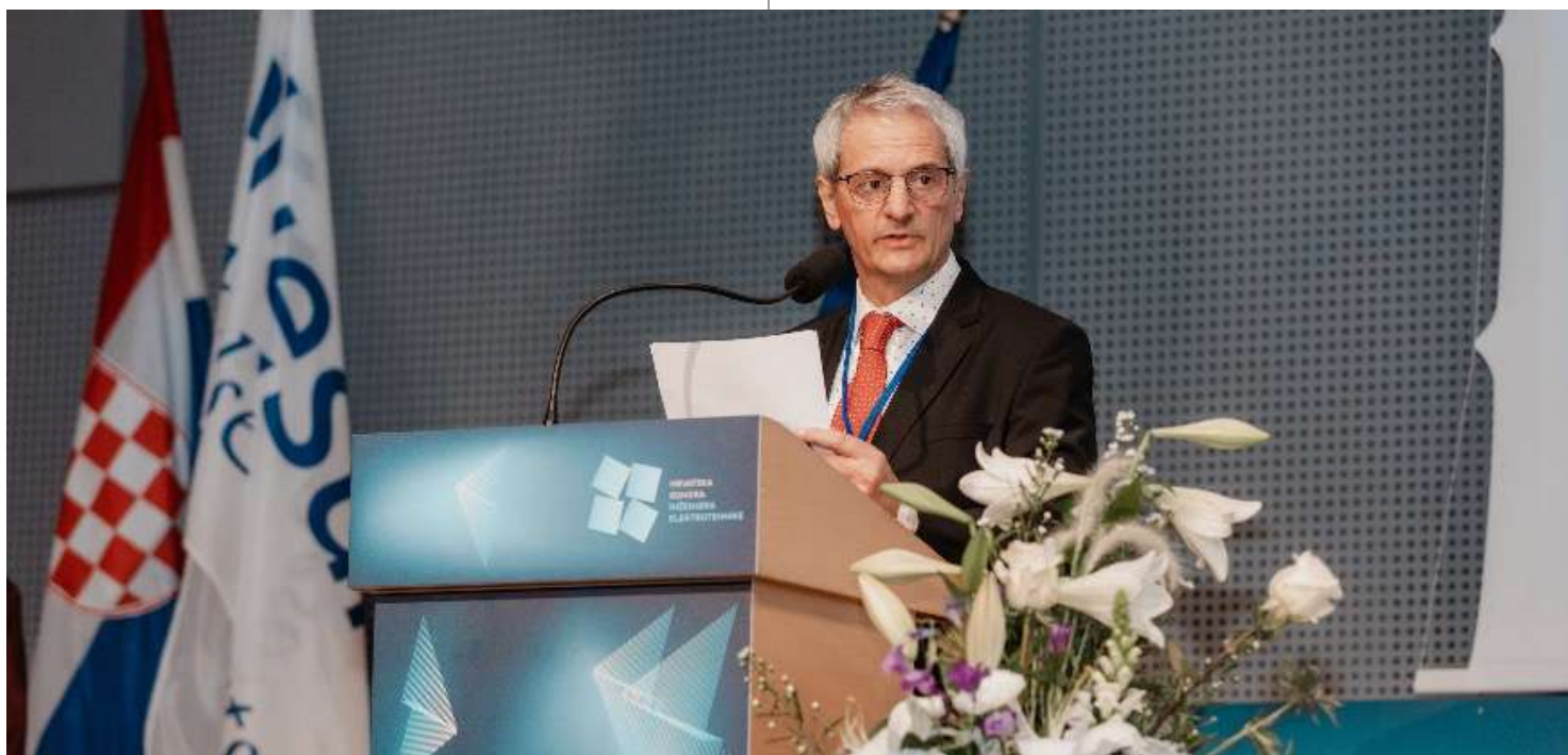
Pozdravni govor Predsjednika HKIE-a