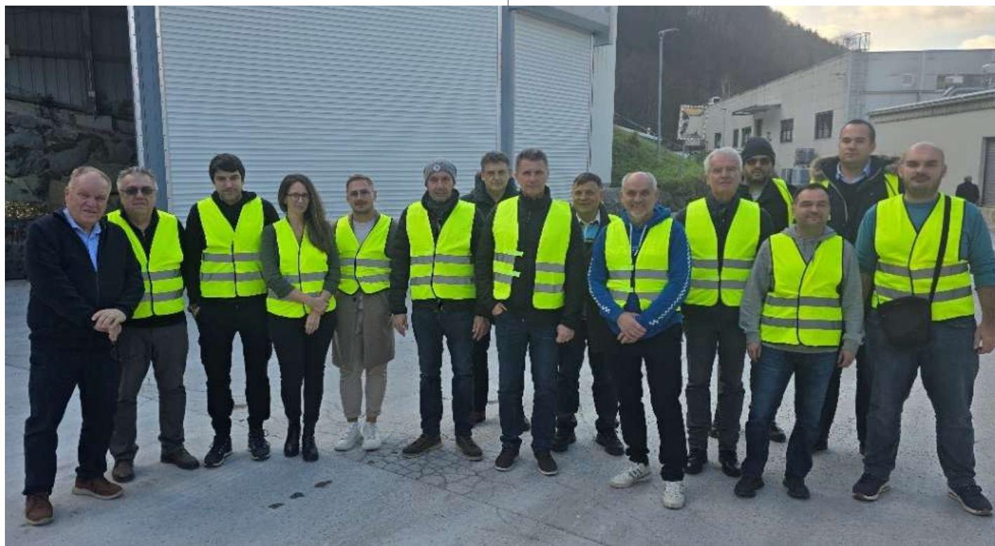
Posjet tvornici ETI u slovenskim Izlakama

zora nije bilo jer nismo dobili ni jednu prijavu. Tijekom nadzora uglavnom su utvrđene nepravilnosti i nedostaci koji se odnose na stručno usavršavanje, zatim na nepravilno i nepravodobno vođenje građevinskog dnevnika te neusklađenost projekata s važećim tehničkim propisima, na greške u proračunima i minimalnim tehničkim zahtjevima. Zatraženo je od članova da nakon proteka od šest mjeseci dostave na kontrolu projekte s ispravljenim nedostacima povjerenstvu. Za nejasnoće mogu se konzultirati kod gosp. Miljačkog koji je predsjednik Povjerenstva.