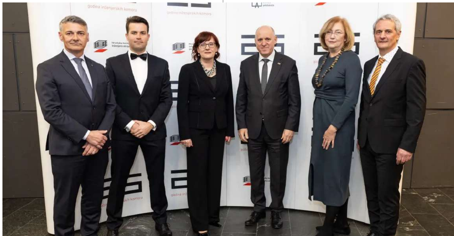
Ministar Branko Bačić s predsjednicima strukovnih komora

Budućnost za inženjere u graditeljstvu donosi izazove inovacije, održivosti, novih tehnologija, digitalizacije i umjetne inteligencije.