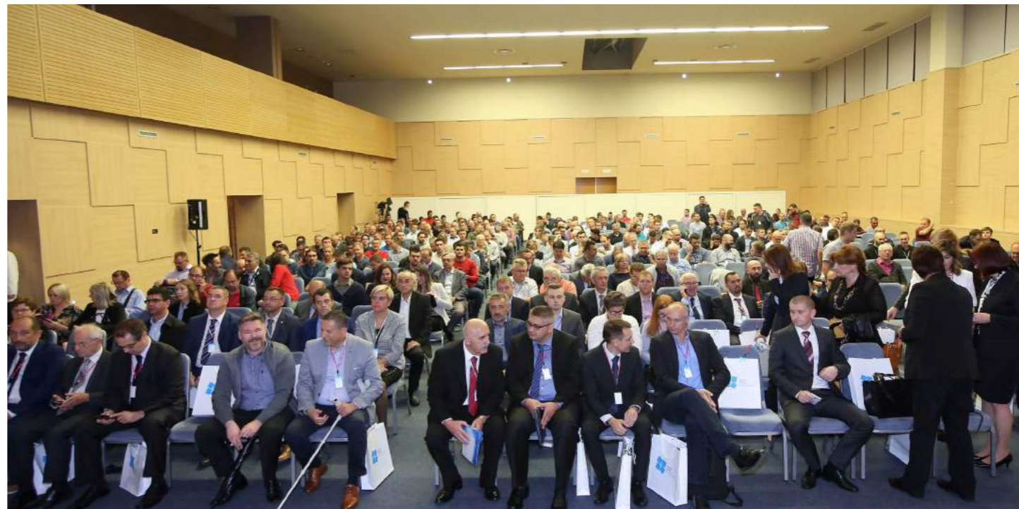
Svečano otvorenje 12. DIE

zemlje i inozemstva, dakako ne na štetu stručnog dijela skupa. Sve pristigle i odabrane radove, a ove ih je godine bilo 20 , prikazali smo u Zborniku radova, a oni autori koji nisu imali predavanje, imali su priliku prezentirati svoje radove na poster-sekciji pa smo tako ove godine imali 17 vrlo kvalitetnih postera također prikazanih u Zborniku radova. I ove godine, kao i ranijih, otvorili smo skup našim mladim potencijalnim budućim članovima – studentima elektrotehnike sa sva četiri naša elektrotehnička fakulteta, tako da je osam darovitih studenata imalo priliku