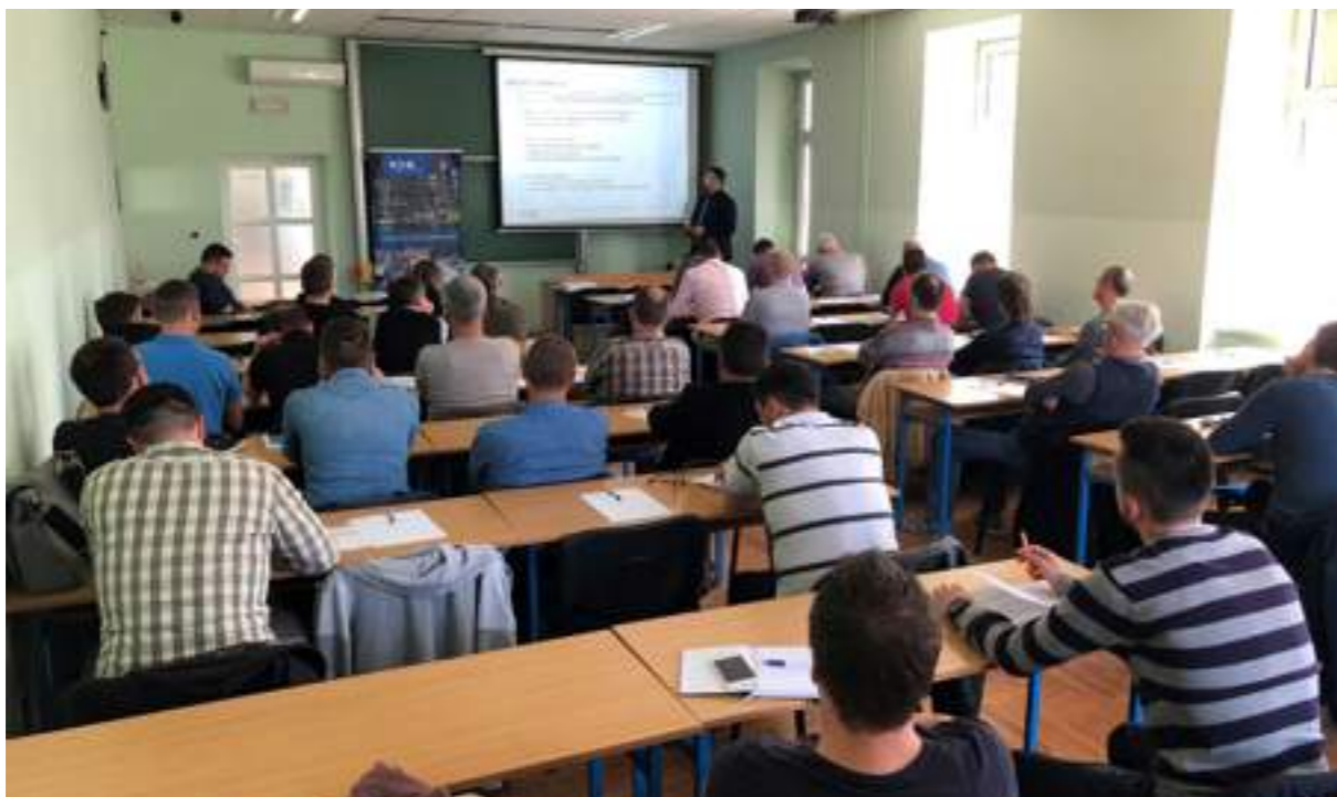
Seminar 16. travnja 2019. - Prevencija i zaštita od toplinskih učinaka električnog luka u niskonaponskim mrežama

teta elektrotehnike, računarstva i informacijskih tehnologija Osijek koje su ustupljene PO-u Osijek na korištenje bez naknade.