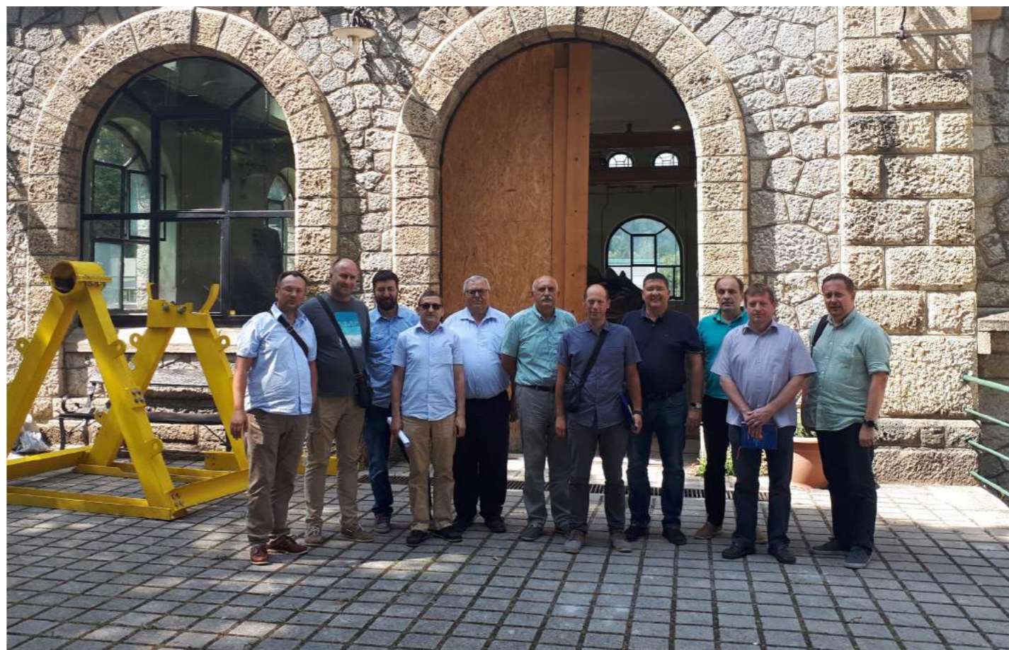
Sastanak VPO Zagreb na HE Ozalj 2