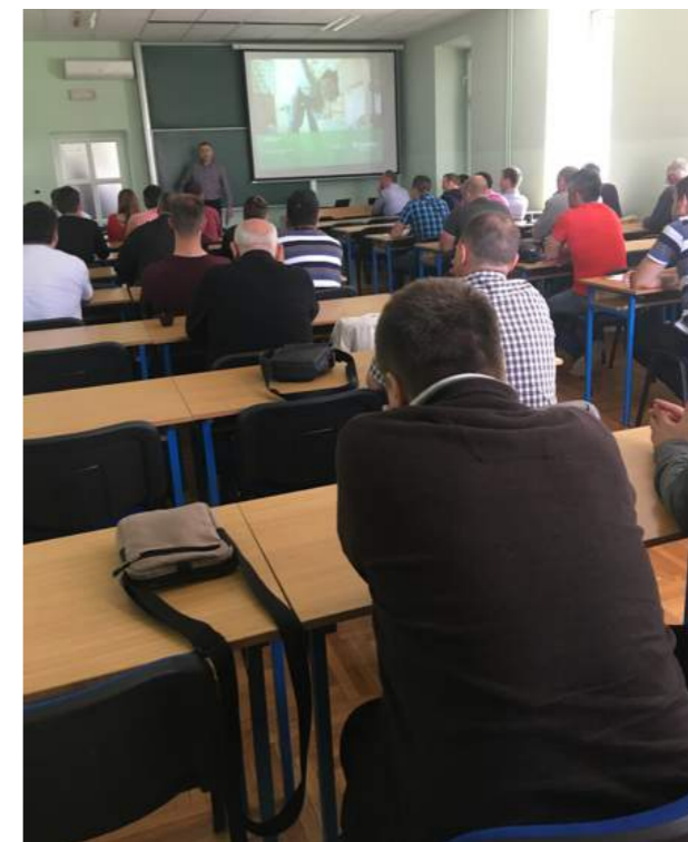
Stručni skup 24. svibnja 2019. Schneider Electric i digitalna transformacija u elektroenergetici

Članovi PO-a Osijek sudjelovali su 28. svibnja 2019. godine na sastanku u Upravnom odjelu za prostorno uređenje i graditeljstvo Osječko-ba-