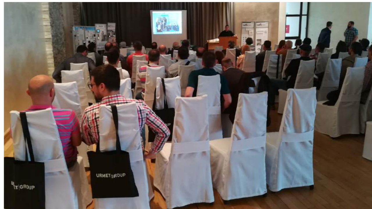
S predavanja „Projektna rješenja upravljanja rizičnim situacijama s adaptivnim evakuacijskim sistemima”

Zboru Područnog odbora Splita od ukupno upisanih 387 članova prisustvovalo je ukupno 56 članova.