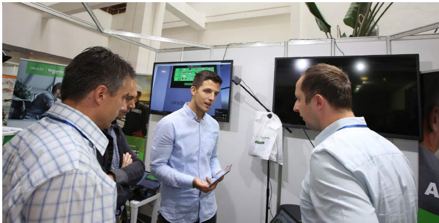
Izložbeni prostor 12. DIE